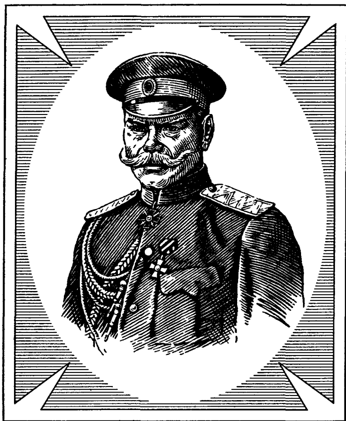
АЛЕКСЕЕВ Михаил Васильевич 1857–1918