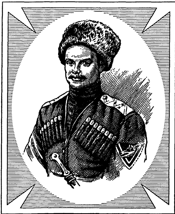
ШКУРО Андрей Григорьевич 1887–1947